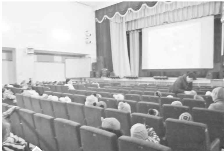
Мультфильм «Трио в перьях» нязепетровские школьники увидели спустя четыре месяца после премьеры

в 57 регионах страны, в том числе 10 в Челябинской области, получили субсидии по результатам конкурса Фонда кино по поддержке кинотеатров в малых и средних городах. Такой конкурс проводился уже в четвертый раз. Общий размер субсидии составил 1 млрд. рублей, каждый кинозал получил на модернизацию около 5 млн. рублей.