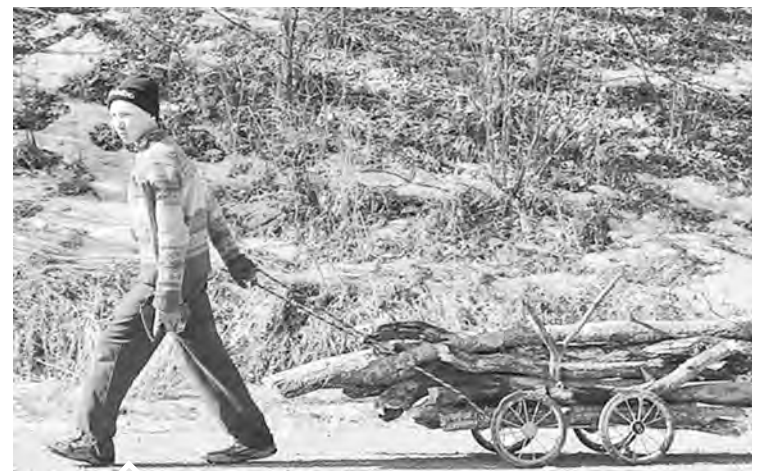
С 1 января 2019 года нязепетровцы смогут свободно собирать валежник для собственных нужд