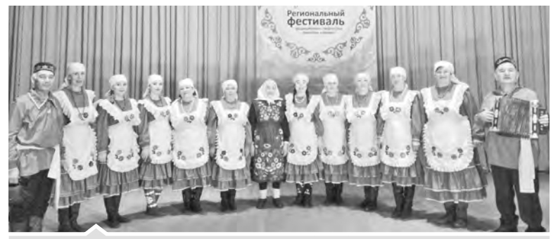
Аптряковцы завоевали на фестивале диплом лауреата II степени