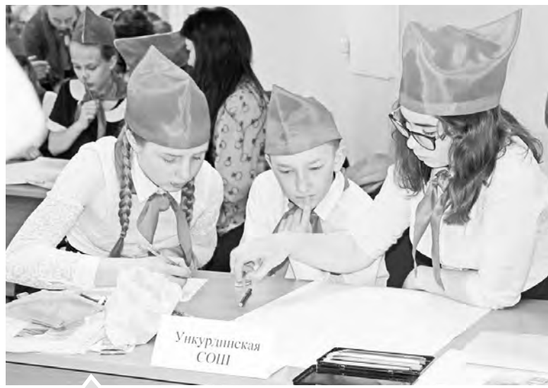
Ункурдинские пионеры показали себя на сборе лучше всех