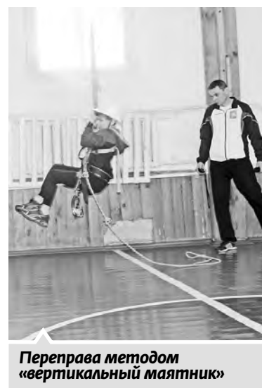
Переправа методом «вертикальный маятник»

От старта до награждения прошло три часа. По итогам соревнований в самой старшей возрастной группе (2000 — 2002 г. р.) победила команда туристов центра помощи детям, на втором и третьем месте — их сверстники из Сатки. В группе 2003 — 2004 г. р. победили гости, второе место заняла команда Шемахинской СОШ, третье — СОШ № 3. В группе 2005 — 2006 г. р. саткинцы вновь оказались лучшими, серебро взяли хозяева из СОШ № 3, шемахинцы — третьи. В младшей возрастной группе (2007 г. р. и моло-