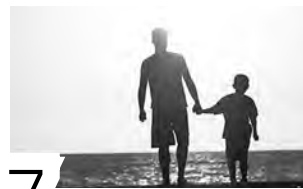
7 установлений отцовства