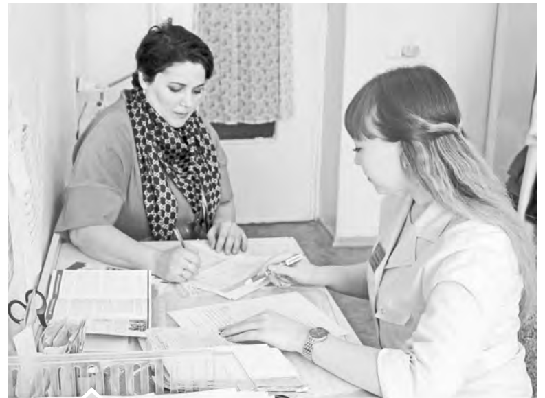
Тщательное заполнение анкеты — важная часть диспансеризации

Всех пациентов направят на анализ уровня холестерина и глюкозы в крови, флюорографию, индивидуальное профилактическое консультирование и прием-осмотр врачом-терапевтом. Для пациен-