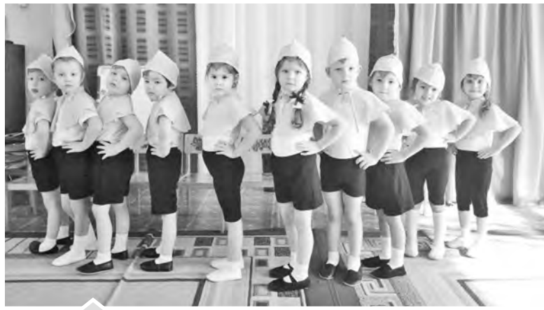
Младшая группа № 2 на занятии по физическому развитию