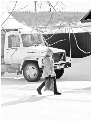
Большинство пешеходов идет по тротуару, а некоторые все-таки по дороге