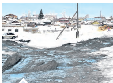
Два КАМАЗа шлама все-таки помогли сделать ул. Кутасова более или менее проезжей

ситуации придется с помощью техники прочищать русло. Впрочем, для нас характер Табунки — это уже повседневный рабочий момент».