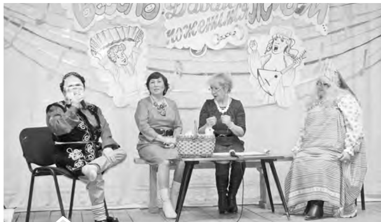
Сценка «Давай пожемнемся» в исполнении коллектива «Умырзая» из Ункурды