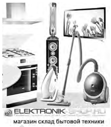
Победителей конкурса «Вся семья в сборе» ожидает приз — сертификат на 5 тыс. руб. в магазин бытовой техники (Нязепетровск, ул. Щербакова, 4Б)