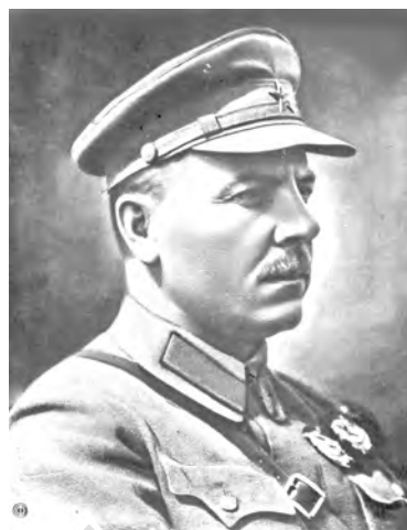
Маршал Советского Союза К. Е. Ворошилов.

Все представились и сели в предложенные кресла вокруг стола. Слева от себя Ворошилов посадил